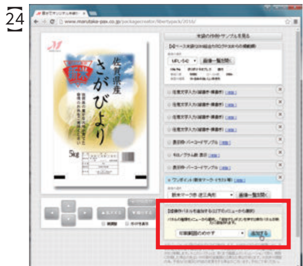
24 親パネルの▼をクリックし、プルダウンメニューから『印刷範囲のめやす』と書かれた列を選択し、『追加する』ボタンをクリックします