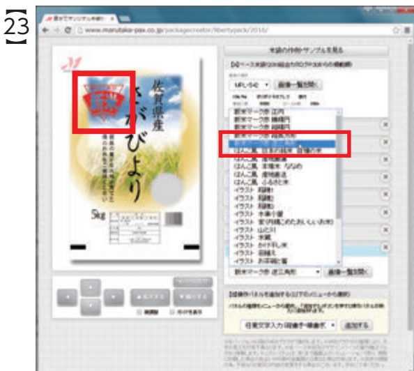
23 プルダウンメニューから、『新米マーク赤 逆三角形』を選択すると、メイン画面の新米マークも変化しました