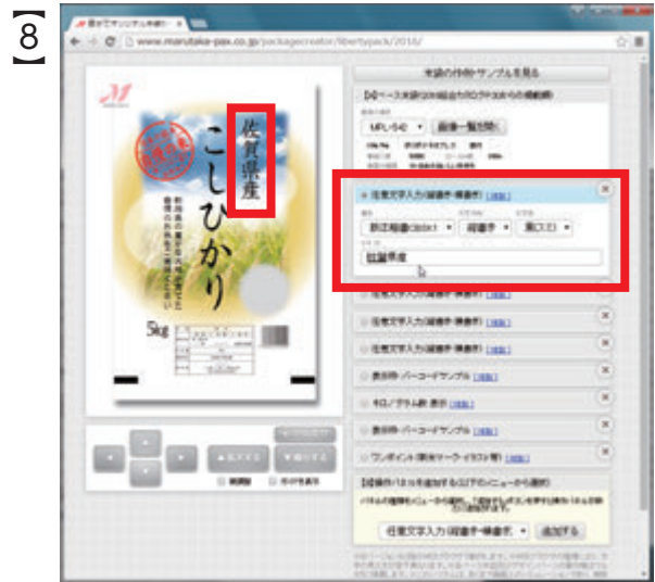
『新潟』の文字を『佐賀』に打ちかえると、メイン画面の文字も『佐賀』に変化します