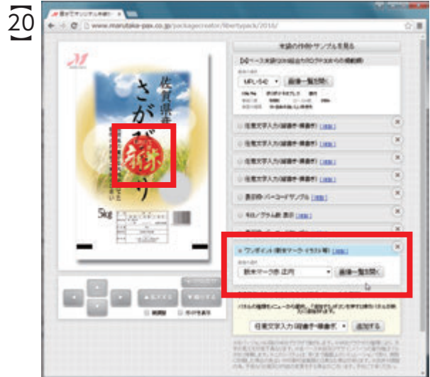
20 「ワンポイント」操作パネルが追加され、メイン画面にも、『新米マーク赤 正円』が新たに出現しました