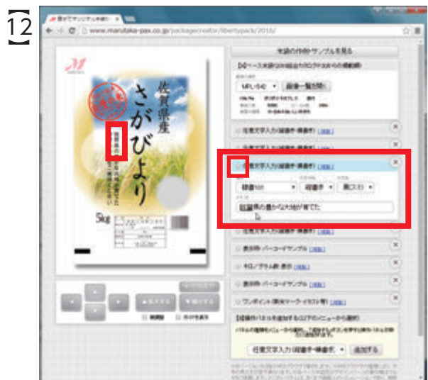
同じ要領で、もうひとつ下の「任意文字入力」パネルを選択し、文章中の『新潟県』を『佐賀県』に変更します