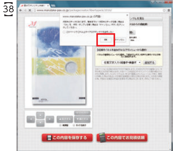
「更新」ボタンをクリックすると、画面中央に 『作成中のデータがあります。開きますか?』の メッセージが表示されるので「OK」を選択します