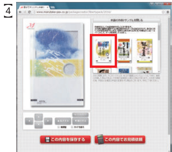
表示された「米袋の作例・サンプル」から 一番左に表示された作例をクリック