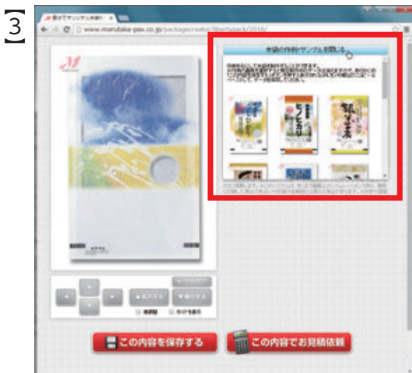
画面右上に小窓が開き 「米袋の作例・サンプル」が表示される