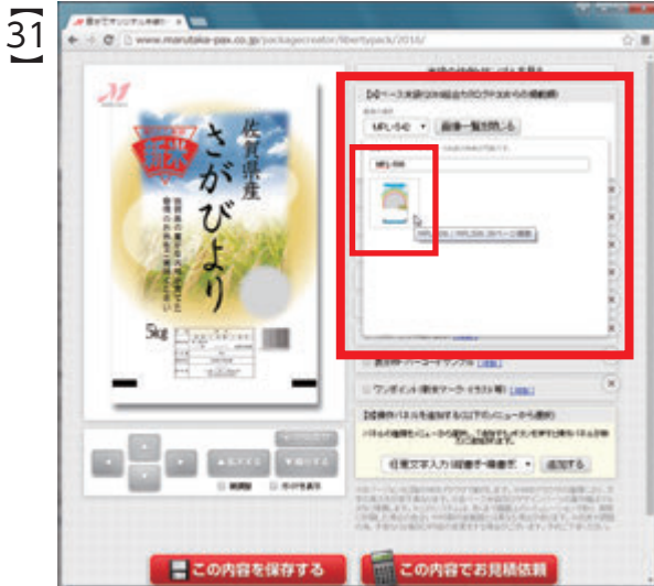
小窓に表示されたベース米袋『MPL-506』の画像をクリックすると