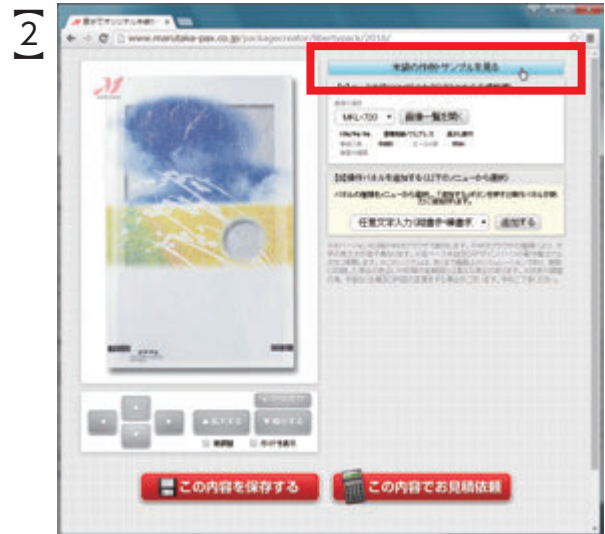
画面右上の 「米袋の作例・サンプルを見る」をクリック