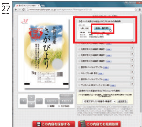
今度は、画面右上の『【A】ベース米袋』パネルの「画像一覧を開く」ボタンをクリックします