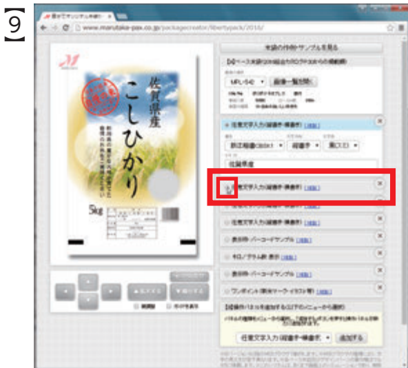
今度は、ひとつ下の「任意文字入力」パネルを選択します