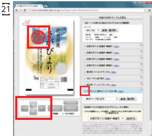
21 「ワンポイント」操作パネルが選択された状態で、メイン画面下の十字ボタンを何度かクリックし、『新米マーク』の位置を左上に移動します