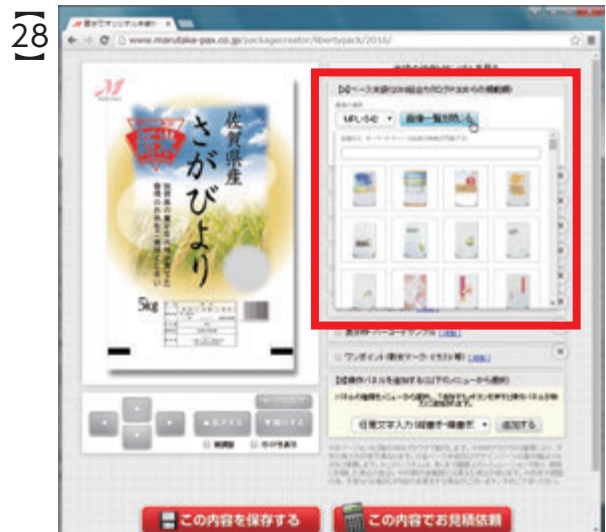
「画像一覧を開く」ボタンをクリックすると、小窓にベース米袋の画像一覧が表示されます