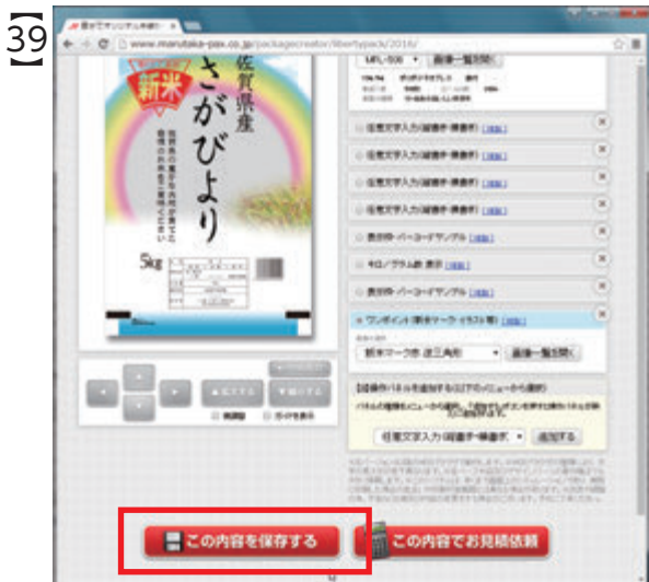
「OK」を選択すると、作成中の画面はそのまま 「この内容を保存する」ボタンが再表示されます