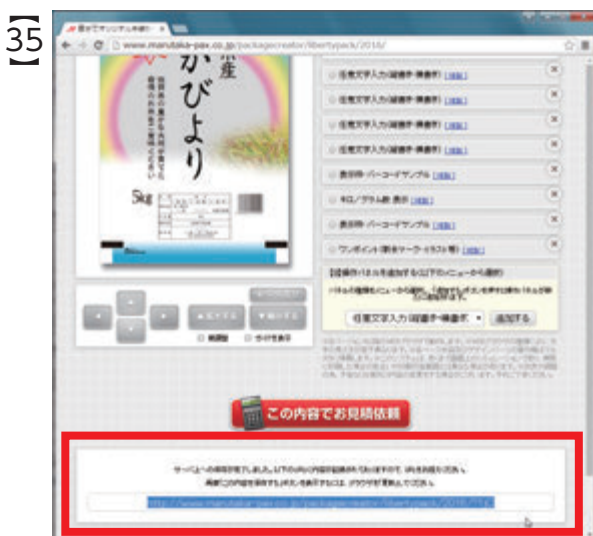
表示されたURL (文字列) を選択し、コピーします