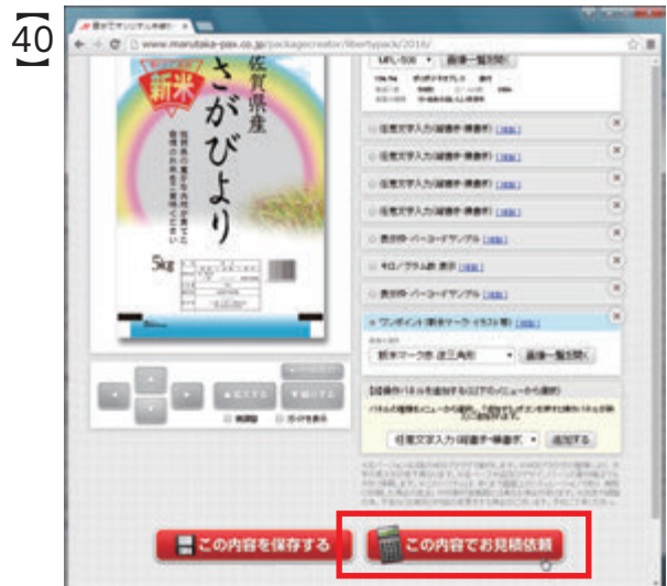
画面右下の「この内容でお見積依頼」ボタンを クリックすると、画面下に必要事項の入力フォームが 新たに表示されます