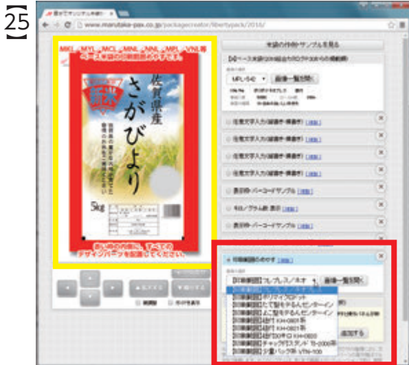
「印刷範囲のめやす」パネルの▼をクリックし、『フレブレス/ネオブレス』が選択されていることを確認します