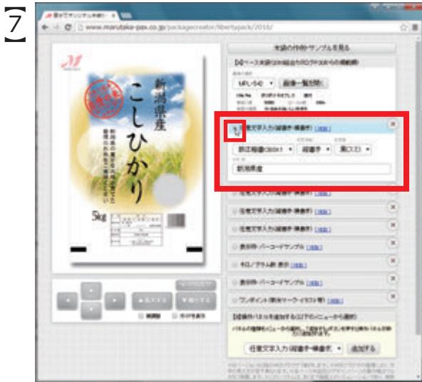
一番上の「任意文字入力」パネルを選択すると『新潟県産』の文字が表示されます

メイン画面の米袋の県産と銘柄を、 『新潟県産こしひかり』から、『佐賀県産さがびより』に変更する作業です