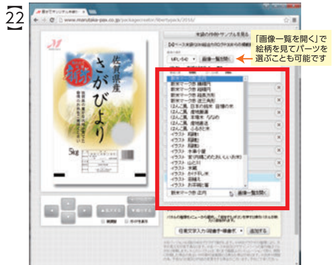
22 「ワンポイント」操作パネルの▼をクリックすると、画像を選択するためのプルダウンメニューが表示されます