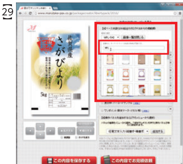
小窓の検索フォームに半角大文字で『MPL』と入力すると、品番に『MPL』が付いたベース米袋のみ、画像一覧に表示されます