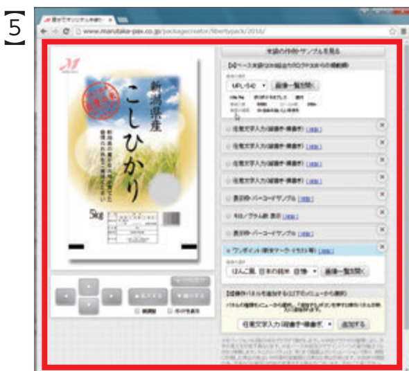
メイン画面の米袋が、クリックした 「作例・サンプル」に置き換わる