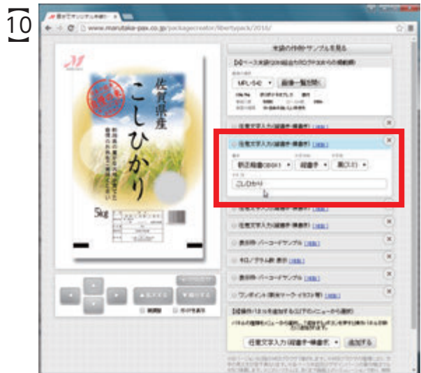
ひとつ下の「任意文字入力」パネルを選択すると『こしひかり』の文字が表示されます