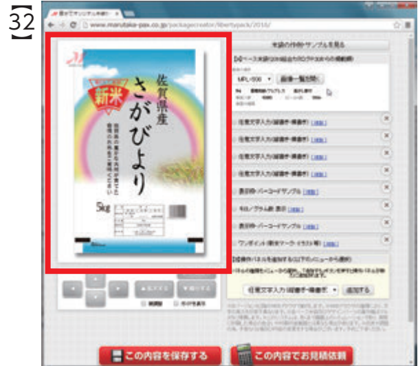
メイン画面のベース米袋が、『MPL-506』に変更されます