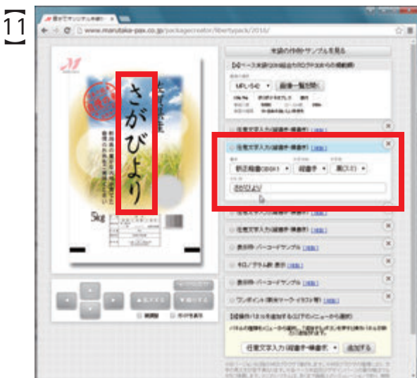
『佐賀県産』と同じ要領で、『こしひかり』を『さがびより』に変更します