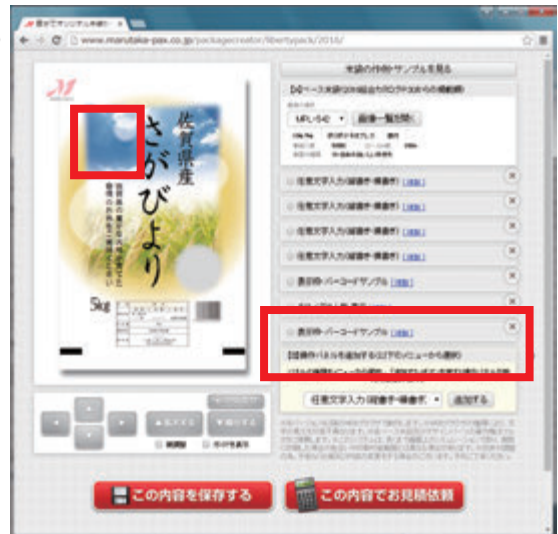
「ワンポイント」の操作パネルが削除され連動して、メイン画面の米袋からも赤いマークの画像が削除されました