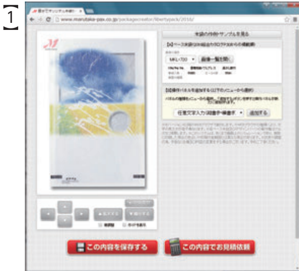
初期画面 (最初に表示される画面)

「米袋の作例・サンプル」の見本を元に、県産と銘柄・ベース米袋を変更する カンタンな作業を通じて、パッケージクリエイターの基本的な使い方を説明します