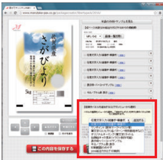
画面右下の『【B】操作パネルを追加する』と書かれた親パネルの▼をクリックし、プルダウンメニューを表示します