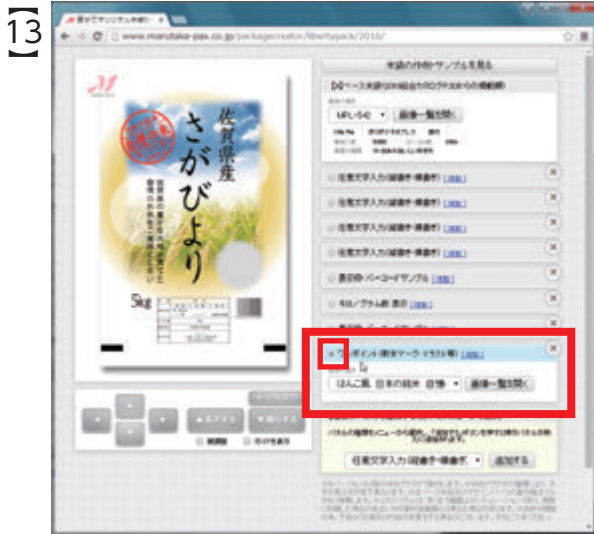
次に、「ワンポイント」と書かれた操作パネルを選択します