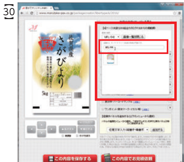
小窓の検索フォームに続けて『MPL-506』と入力すると、該当する品番のベース米袋のみが、画像一覧に表示されます