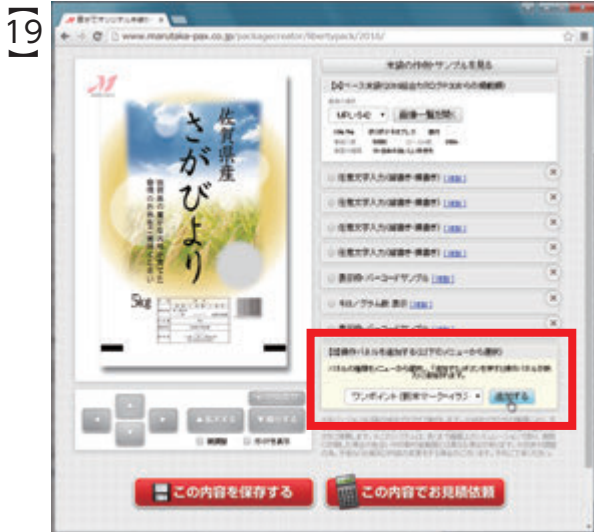
19 親パネル右側の「追加する」ボタンをクリックします