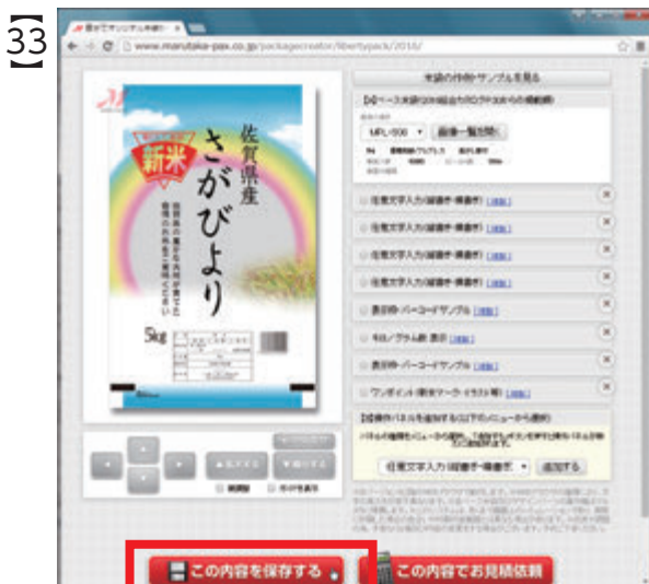
今の状態を保存しておきたいと思うので画面左下の「この内容を保存する」ボタンをクリックします