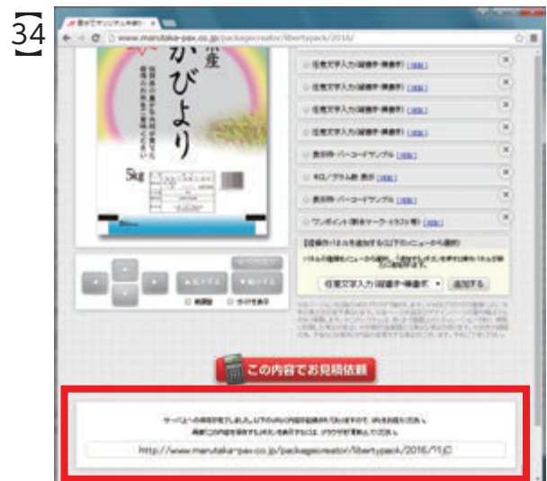
「この内容を保存する」ボタンをクリックすると画面下にURL (文字列) が表示されます