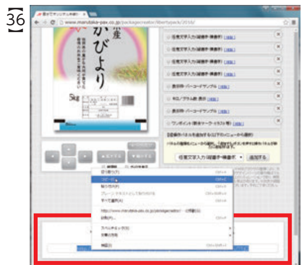
コピーしたURL (文字列) は、メモ帳やワード、メールなどに貼り付けて保存してください。この時点から作業を再開することができます