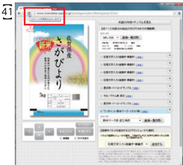
「この内容でお見積依頼」ボタンおよび 「この内容を保存する」ボタンを再表示するには WEBブラウザの「更新」ボタンをクリックします