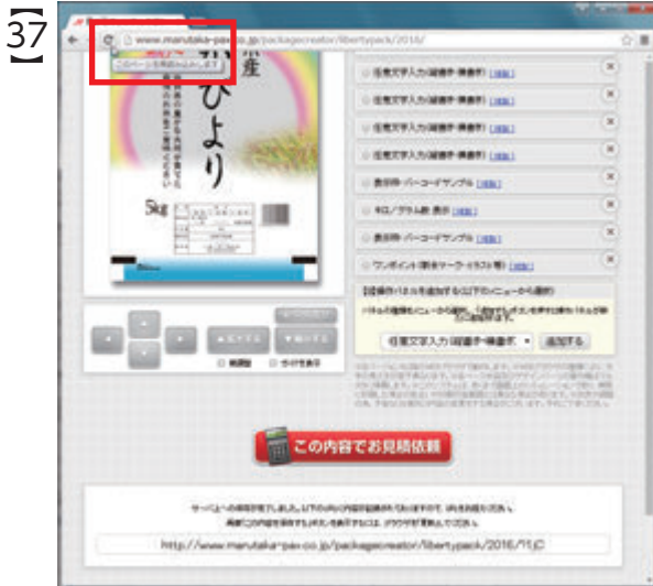
画面上から消えた「この内容を保存する」ボタンを 再表示するには、 WEBブラウザの「更新」ボタンをクリックします