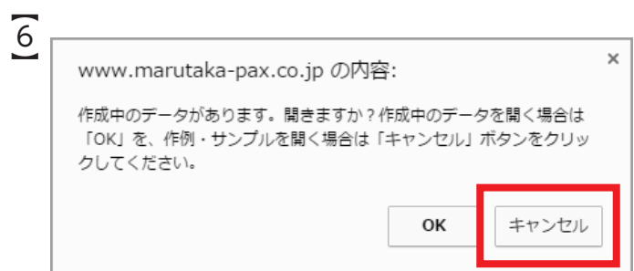
画面中央に、 『作成中のデータがあります。開きますか？』の メッセージが表示された場合は 「キャンセル」をクリックすると 「作例・サンプル」が表示されます